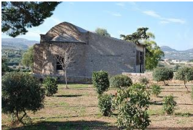
Πρώην εκκλησία αγίου Ανδρονίκου, Πόλη Χρυσοχούς