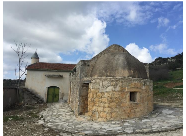
Εκκλησία αγίου Νικολάου, Μελάντρα. Κατά την τουρκοκρατία μετατράπηκε σε σάβλο εξυπηρετώντας προφανώς τις ανάγκες στο δίπλα τζαμί.