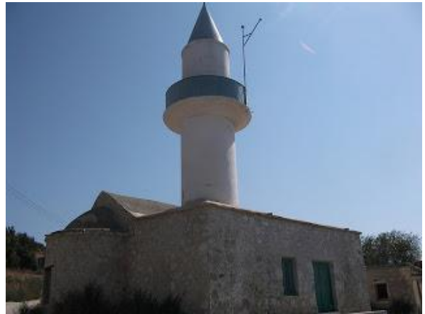
Πρώην εκκλησία αγίας Αικατερίνης, Πελαθούσα