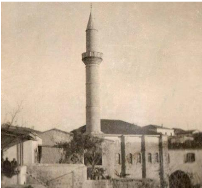
Γενί τζαμί (νέο τζαμί) βομβαρδίστηκε το 1964, Πάφος.