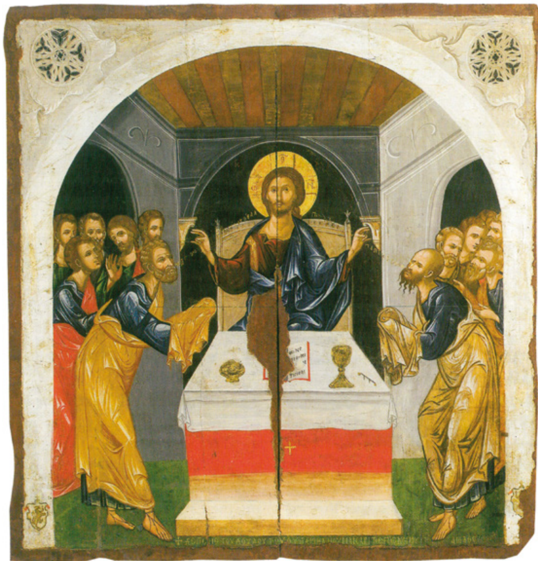
Ἡ Κοινωνία τῶν Ἀποστόλων, τέλος 15ου αἰῶνος, ἰ. ναός Παναγίας Χρυσαιλιώτισσης Λευκωσίας, 131 X 126 εκ., Βυζαντινὸ Μουσεῖο Ἰδρύματος Ἀρχιεπισκόπου Μακαρίου Γ', Λευκωσία (BMIAM.197)