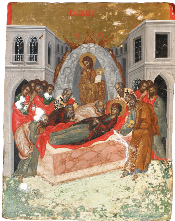
Η Κοίμησις της Θεοτόκου, 1540, Ιερά Μονή Παναγίας Τροοδίτισσας.