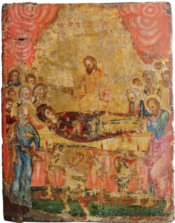
Η Κοίμησις της Θεοτόκου, 19ου αιώνα, Ιερά Μητρόπολις Πάφου.