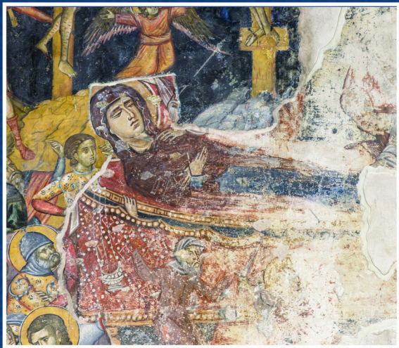
Η Κοίμησις της Θεοτόκου, τοιχογραφία. τέλη 12ου αιώνα, Ιερός Ναός Αγίας Παρασκευής, Γεροσκήπου.

Φωτογραφία εμπροσθοφύλλου: Η Κοίμησις της Θεοτόκου, 1768, Θελέτρια.