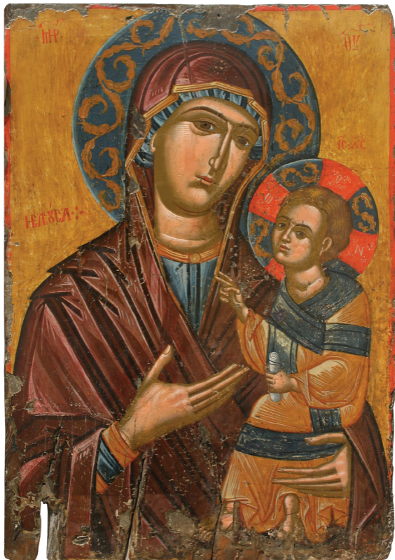
Παναγία η Ελεούσα, 16ος αιώνας, Δρύνια, Επισκοπή Αρσινόης.