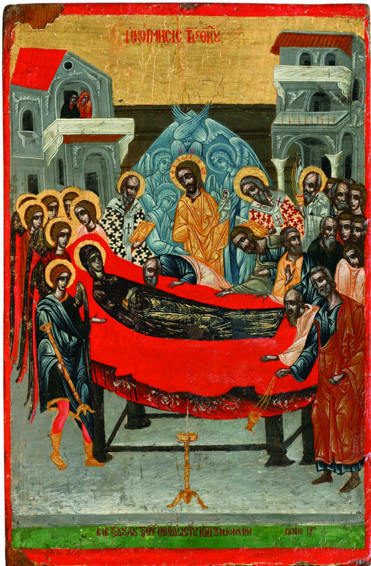
Η Κοίμησις της Θεοτόκου, 18ου αιώνα, Μουσείο Επισκοπής Αρσινόης.