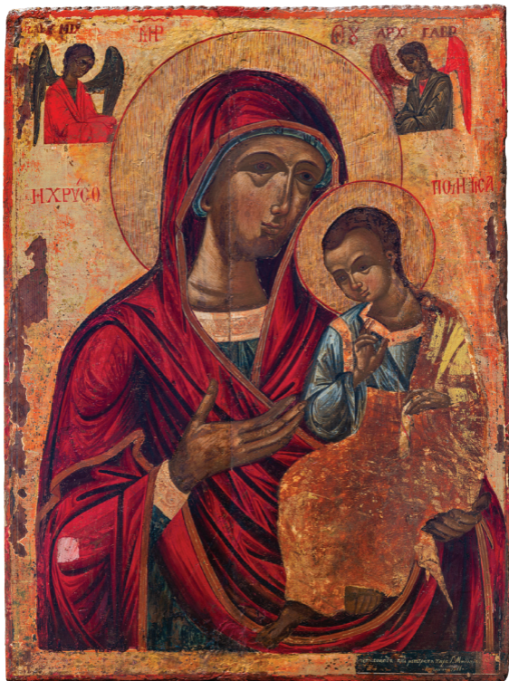
Παναγία Χρυσοπολίτισσα, αρχές 17ου αιώνα, Ιερά Μητρόπολις Πάφου.