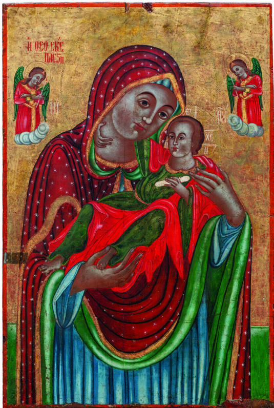
Παναγία Θεοσκέπαστη, 19ος αιώνας, Ιερός Ναός Παναγίας Θεοσκέπαστης, Κάτω Πάφος