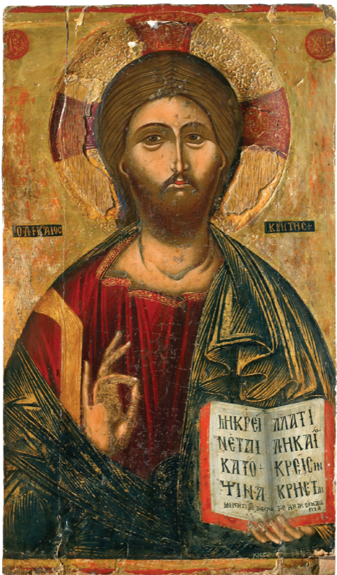
Ιησούς Χριστός, 16ου αιώνα, Μουσείο Επισκοπής Αρσινόης.