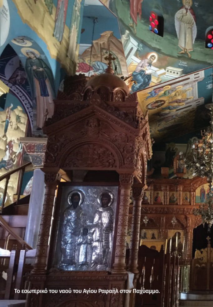
Το εσωτερικό του ναού του Αγίου Ραφαήλ στον Παχύαμμο.