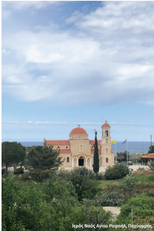
Ιερός Ναός Αγίου Ραφαήλ, Παχύραμος.