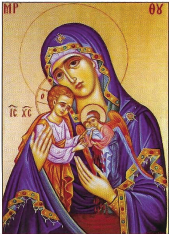
Ευλογία Μοναχού Γαβριήλ Κελί Οσίου Χριστοδούλου εν Πάτμω Μονής Κουτλουμουσίου Αγίου Όρους