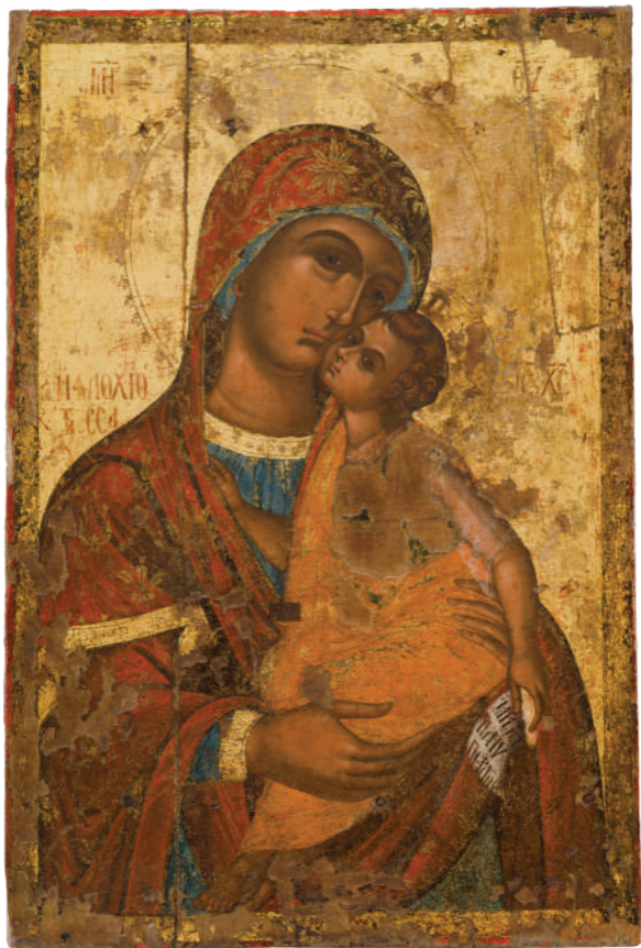
Παναγία η Φιλοχιώτισσα - Σιλβέστρος, 1570 - Φιλούσα Κελοκεδάρων, ναός Αγίας Μαρίας