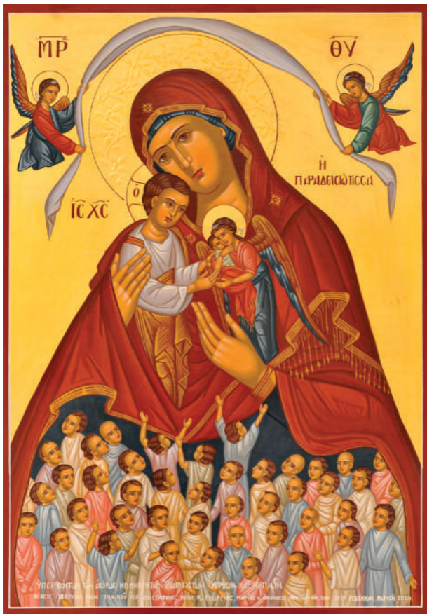
Παναγία Παραδεισιώτισσα - 2020 - Παχύαμμος