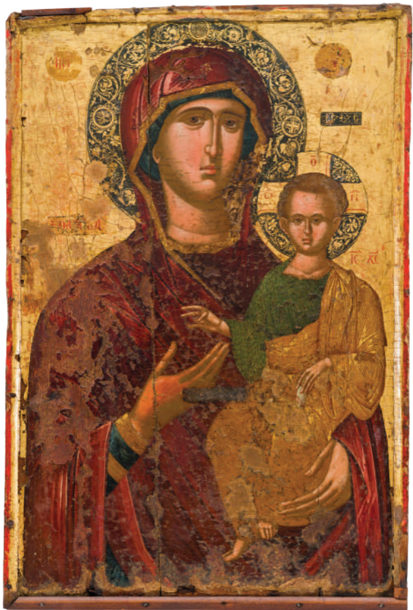
Παναγία Η Οδηγήτρια- Α'Μισό 16ου αιώνα - Πάφος, Μητροπολιτικό Μέγαρο