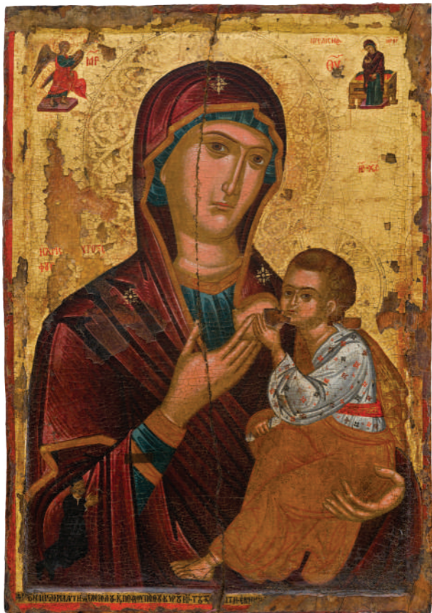
Παναγία Χρυσογαλακτοτροφούσα με δωρητή Ιωάννη - Μέσα 16ου αι. - Γαλαταριά, ναός Παναγίας Γαλατούσας