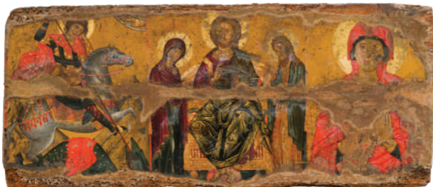
Άγιος Γεώργιος, Μικρή Δέηση και αγία Μαρινα - 16ος αιώνας - Πάφος, ναός Αγίου Κενδεα