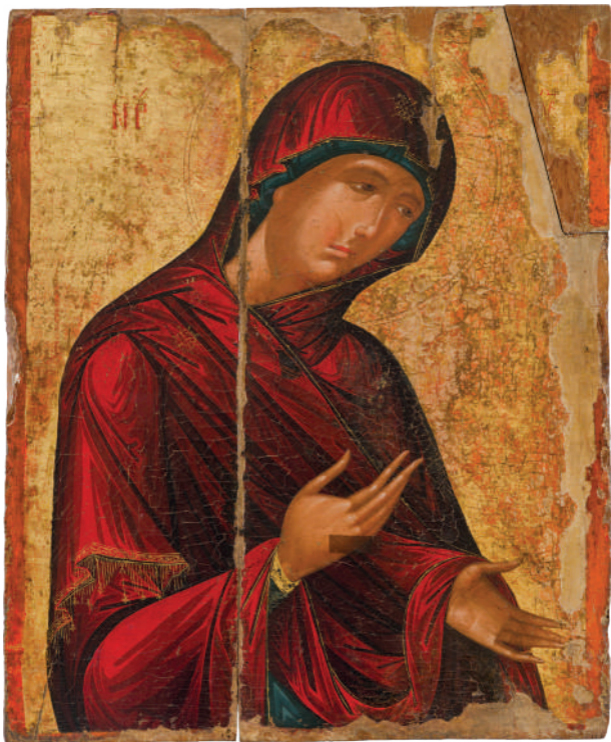
Παναγία Δεόμενη - Αρχές 16ου αιώνα - Κάτω Αρχιμανδρίτα, ναός Χρυσελευούσης