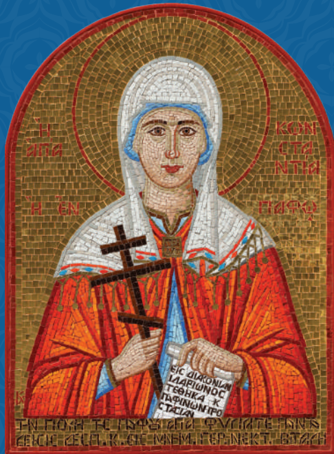
Η ΑΓΙΑ ΚΩΝΣΤΑΝΤΙΑ Η ΕΝ ΠΑΦΩ Προστάτιδα της πόλης της Παφου