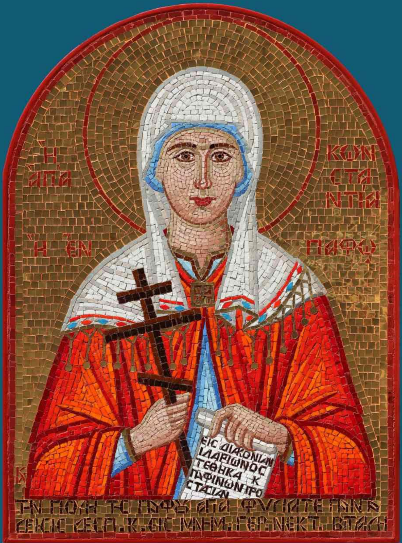
Η ΑΓΙΑ ΚΩΝΣΤΑΝΤΙΑ Η ΕΝ ΠΑΦΩ