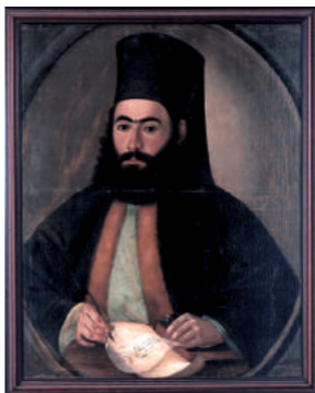
Ο Εθνομάρτυς Αρχιεπίσκοπος Κυπριανός

Η Γενική Συνέλευση της Φιλικής Εταιρείας, που συνήλθε στο Ισμαήλιο την 1η Οκτωβρίου 1820, υιοθέτησε την άποψη του Αρχιεπισκόπου Κύπρου Κυπριανού να μην επαναστατούσε η Κύπρος, λόγω της γεωγραφικής της θέσης. Επισημοποιήθηκε, έτσι, η πολιτική της αναμονής,