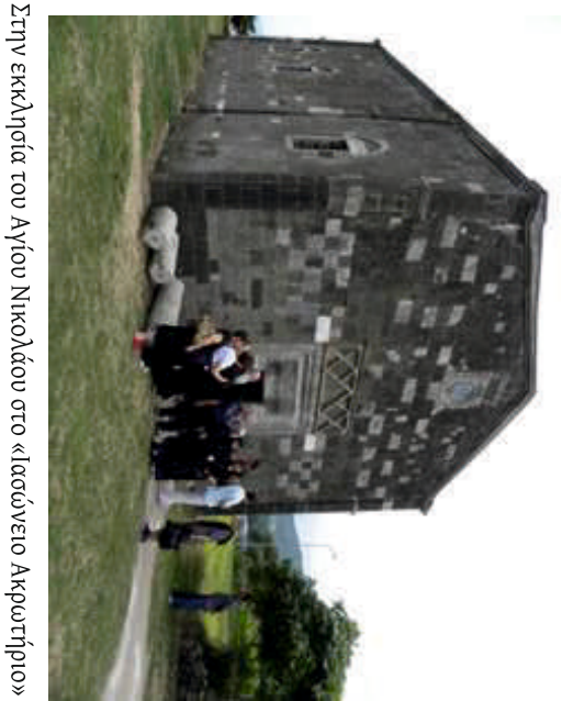
Στην εκκλησία του Αγίου Νικολάου στο «Ιασώνειο Ακρωτήριο»