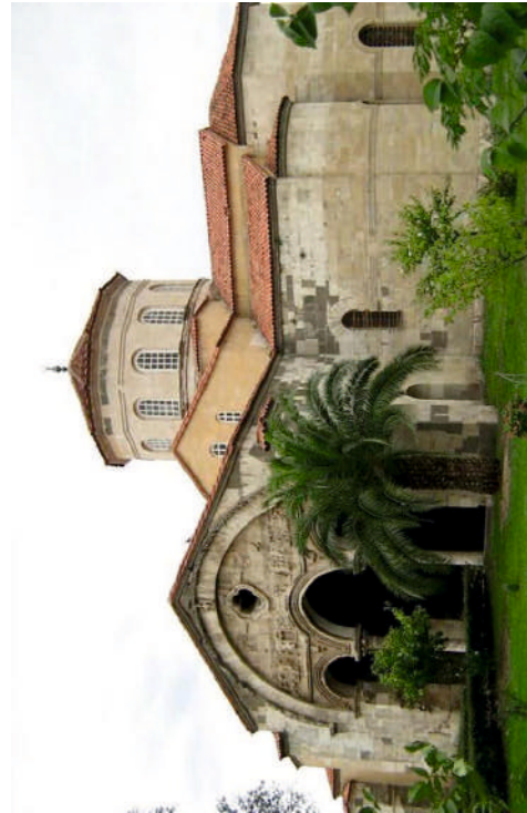
Η Αγία Σοφία στην Τραπεζούντα