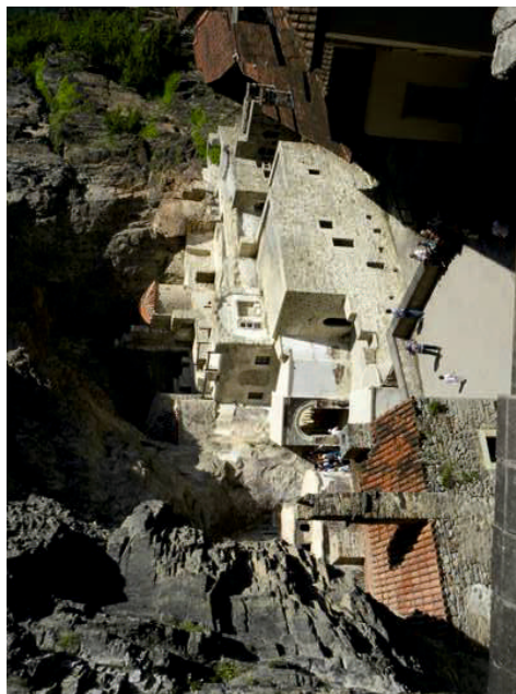
Η Παναγία του Σουμελά