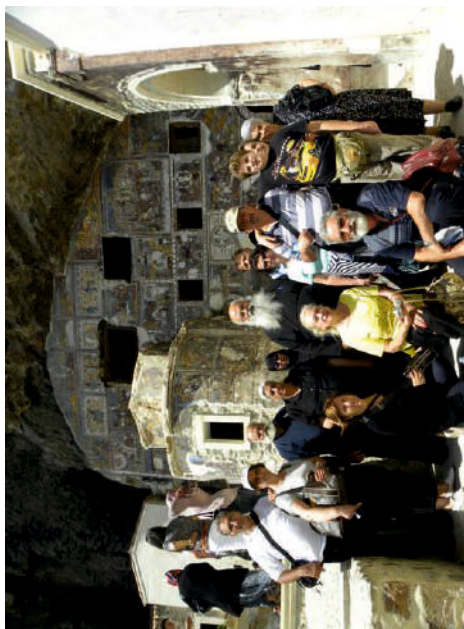
Ο Μητροπολίτης Πάφου και οι προσκυνητές στη μονή Σουμελά