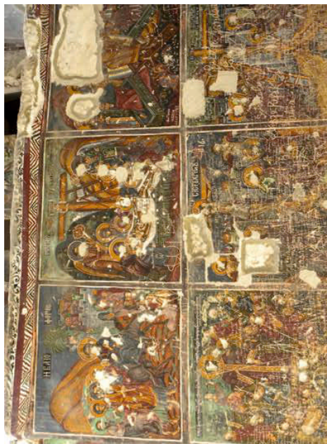
Από τις τοιχογραφίες της μονής Σουμελά