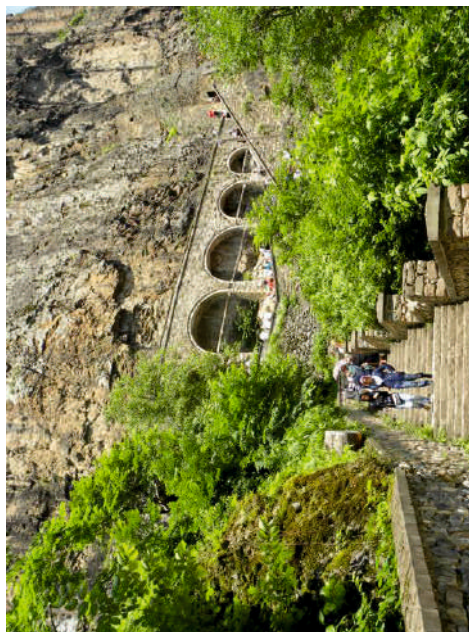
Η Παναγία του Σουμελά