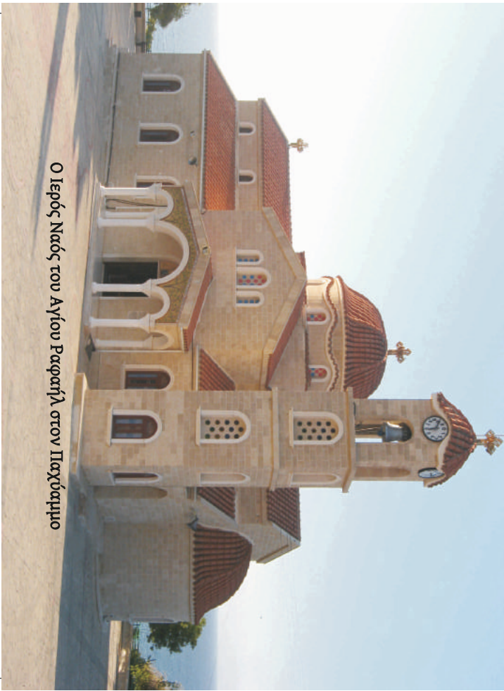
Ο Ιερός Ναός του Αγίου Ραφαήλ στον Παχύραμμο