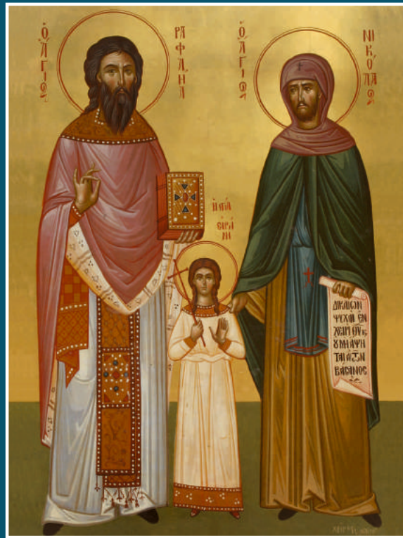
ΙΕΡΟΣ ΝΑΟΣ ΑΓΙΟΥ ΡΑΦΑΗΛ ΠΑΧΥΡΑΜΜΟΥ ΗΜΕΡΟΛΟΓΙΟ 2017