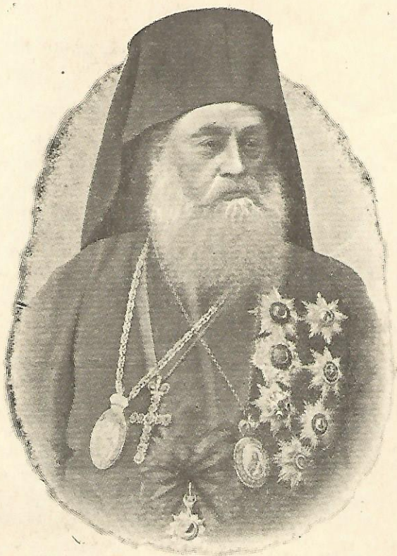
Η Α.Θ.Π. Ο ΟΙΚΟΥΜΕΝΙΚΟΣ ΠΑΤΡΙΑΡΧΗΣ ΙΩΑΚΕΙΜ Ο Γ΄.