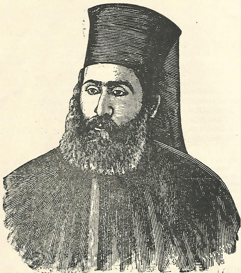
Ο ΕΘΝΟΜΑΡΤΥΣ ΑΡΧΙΕΠΙΣΚΟΠΟΣ ΚΥΠΡΙΑΝΟΣ