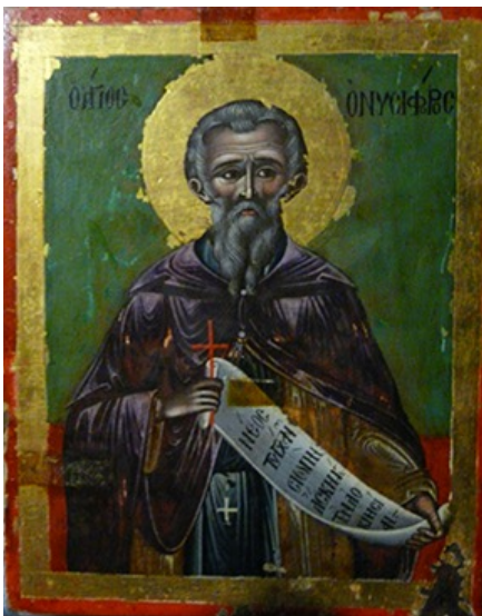
Μονή Χρυσορρογιατίσσης, Πάφος. Εικόνα Αγίου Όνησιφόρου (18ος αί.).