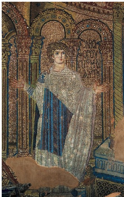
Θεσσαλονίκη, Μανσωλεῖον Μ. Κωνσταντίνου (Ροτόντα). Ψηφιδωτὸ τροῦλλου. Ὁ στρατιώτης Ὀνησιφόρος (ἀπὸ Χ. Μπακιρτζή, ἐπιμ., Ψηφιδωτὰ τῆς Θεσσαλονίκης, 4 ος -14 ος αἰώνας , Ἀθήνα: Ἐκδόσεις Καπόν, 2012, Εἰκ. 34).

Ὁ Ἐρατοσθένης, οἱ ὑδρογονάνθρακες καὶ ἡ ἀναστήλωση τοῦ Ἁγίου Ὀνησιφόρου