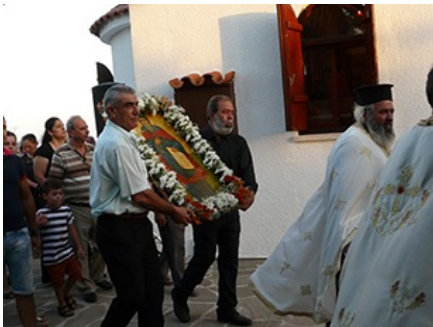
Αναρίτα. Περιφορά εικόνας Αγίου Όνησιφόρου, Έσπερινός, 17 Ιουλίου 2015.