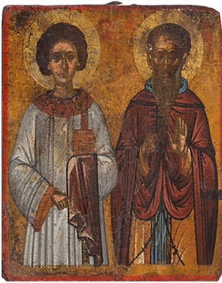
Ο Άγιος Όνησιφόρος και ο Άγιος Κασσιανός, 16ος αί. (Μητρόπολη Λεμεσού).