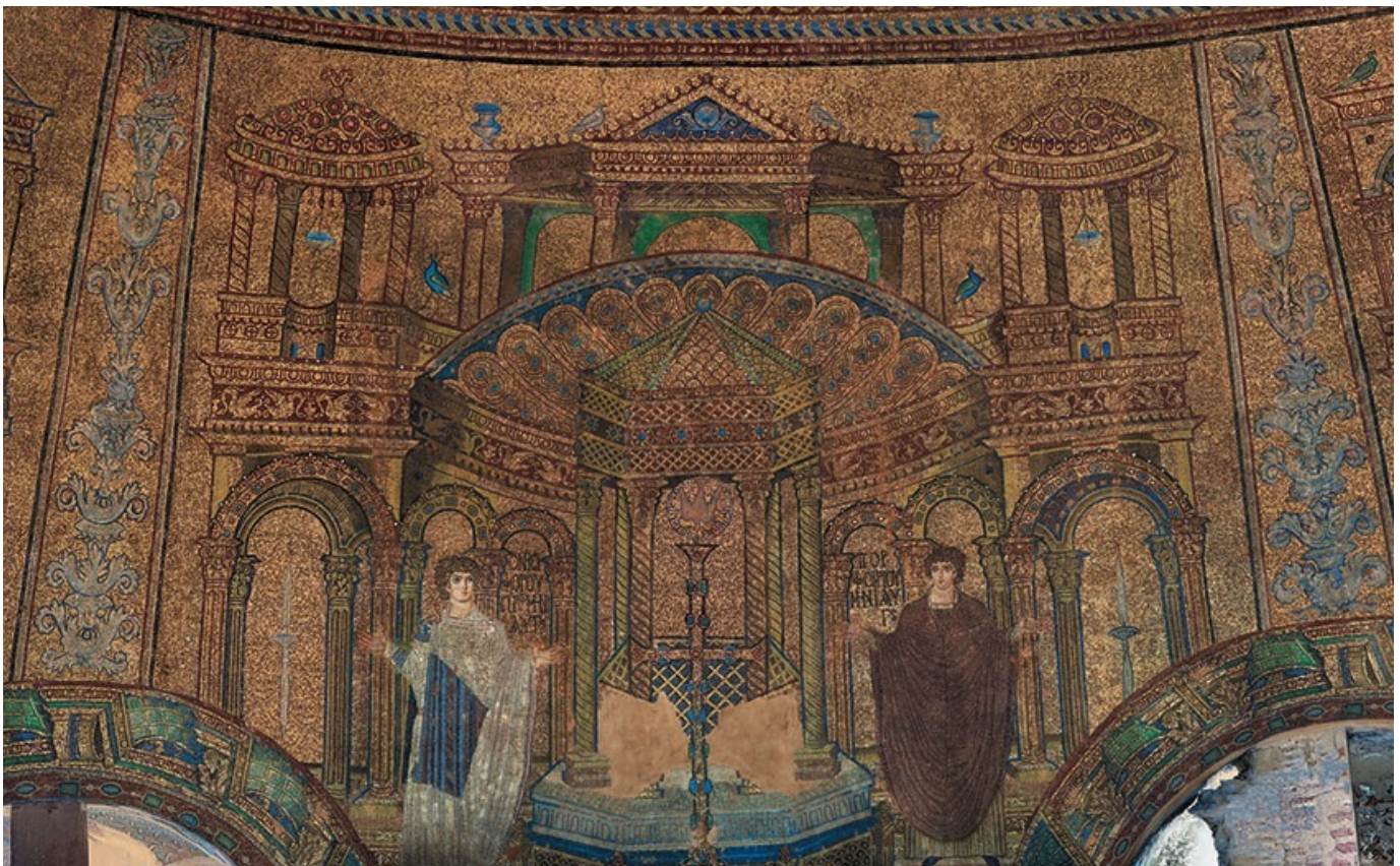
Θεσσαλονίκη, Μανσωλείον Μ. Κωνσταντίνου (Ροτόντα). Ψηφιδωτό τροϋλλου. Σύνθεση βορείου και νοτίου διαχώρου: Τό πολεμικό σταυρόσχημο σίγνον (σημαία) του Μ. Κωνσταντίνου, ό Όνησιφόρος και ό Πορφύριος (άπό Χ. Μπακιριτζή, έπιμ., Ψηφιδωτά τής Θεσσαλονίκης, 4 ος -14 ος αιώνας, Αθήνα: Έκδόσεις Καπόν, 2012, Εικ. 35).

Ή εικονογραφική αϋτη παράδοσις του Αγίου Όνησιφόρου ως νέου αϋλικού αξιωματοϋχού και οϋχι ως γέροντος άσκητου άντλει από τήν παλαιότερα και σημαντικότερα όλων τών άπεικονισέων του, εύρισκομένη στόν τροϋλλο τής Ροτόντας Θεσσαλονίκης. Τήν Ροτόντα ίδρυσε, ως γνωστόν, ό Μέγας Κωνσταντίνος ως μαυσωλείον του και έκόσμησε με λαμπρά