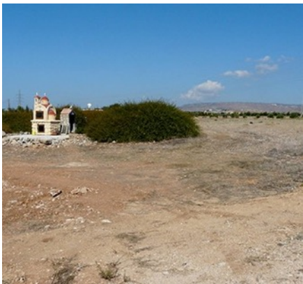
Το προσκυνητάρι της Παναγίας Ιαματικής.

του Έρατοσθένη, ύποθαλάσσιου όρους και ήφαιστείου στην ΑΟΖ (Αποκλειστική Οικονομική Ζώνη) της Κύπρου, περί του έντοπισμού και της εκμεταλλεύσεως των οποίων πολὺς γίνεται τελευταίως λόγος.