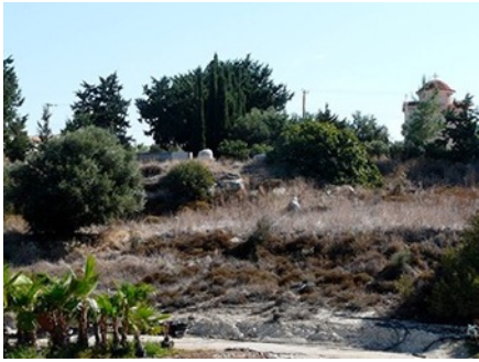
Η όχθη του ποταμού της Αναρίτας και στο βάθος η εκκλησία του Αγίου Όνησιφόρου, σήμερα.