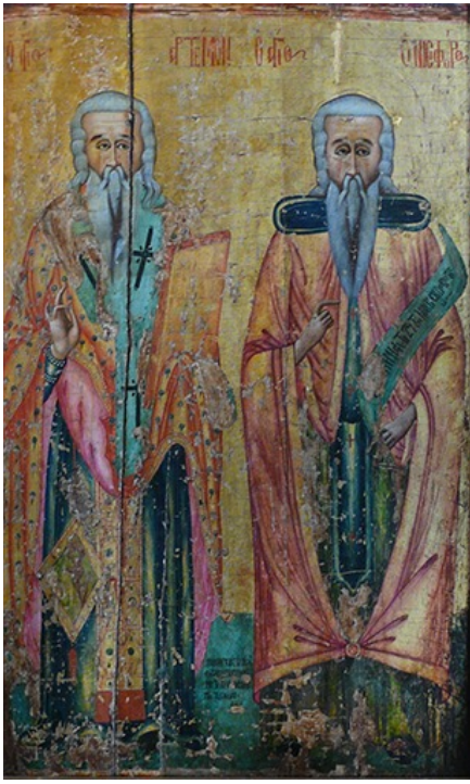
Μονή Χρυσορρογιατίσσης, Πάφος. Εικόνα Αγίου Όνησιφόρου (18ος αί.).

προσκυνητάρι εικόνα, αφιέρωμα Άντωνίου προσκυνητού, τής συμβίου και τών τέκνων του έτους 1801, εις τήν όποϊαν εικονίζεται εις χρυσόν κάμπον ό Άγιος Όνησιφόρος ως γέρων γενειοφόρος άσκητής φορών μοναχικών μανδύα αλλά και έπωμίδες στρατιωτικές, όμου μετά του Αγίου Άρτέμωνα, ένός εκ τών τριακοσίων Αλαμανών λεγομένων άγιων τής Κύπρου. Εις τό ειλητάριόν του αναγράφεται 'Ιησοϋ' μνήμη φωτίζει τόν νοϋν κ(αι) έκδιόκει τούς/ δαίμονας. Λείψανο τής άγίας χειρός του Όνησιφόρου σώθηκε στή Μονή Χρυσορρογιατίσσης στο δάσος τής Πάφου, τό όποϊόν ό 'Ηγούμενός της πατήρ Διονύσιος έδώρισε πρό έτών στήν Κοινότητα τής Αναρίτας, στήν έκκλησία Αγία Μαρίνα τής όποϊας σήμερα φυλάσσεται έντός άργυράς λειψανοθήκης.